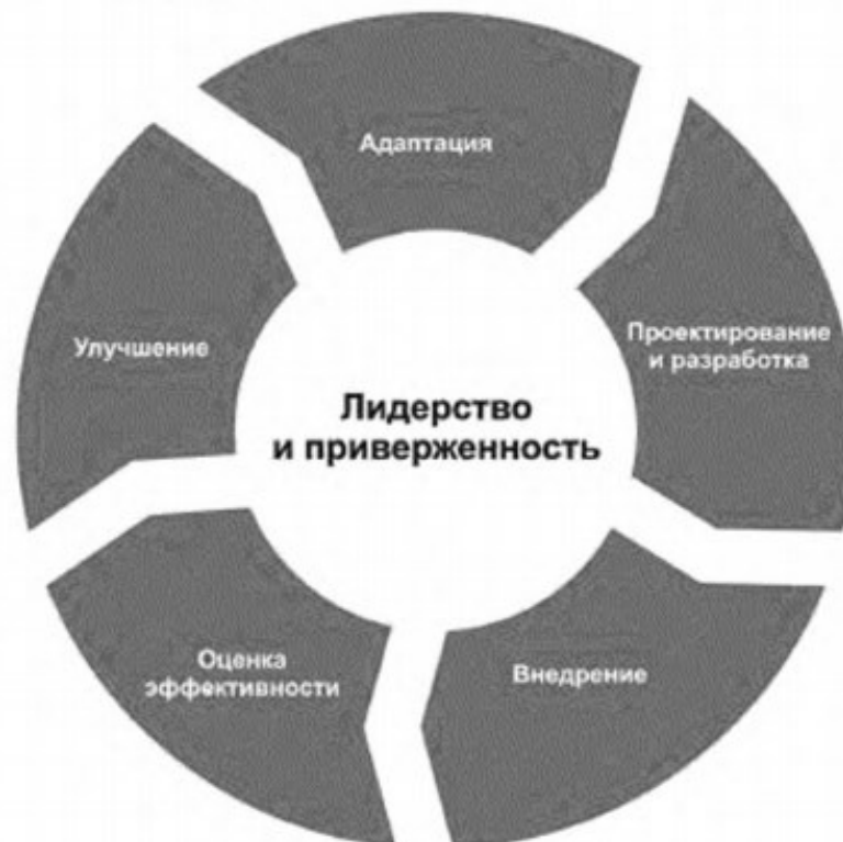
Рисунок 3 — Структура

Внедрение структуры менеджмента риска включает в себя интеграцию, проектирование и разработку, внедрение, оценку и улучшение менеджмента риска в организации. На рисунке 3 представлены компоненты структуры.