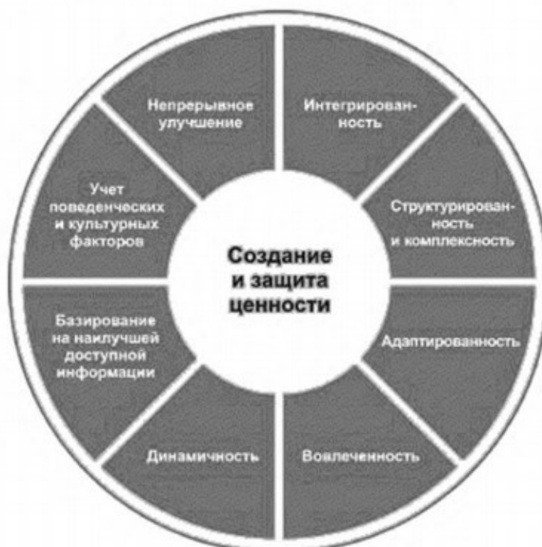
Рисунок 2 — Принципы

Принципы, представленные на рисунке 2, устанавливают характеристики эффективного и результативного менеджмента риска, отражают его ценности и объясняют его назначение и цель. Эти принципы являются основой менеджмента риска и должны учитываться при создании структуры и процесса менеджмента риска организации. Соблюдение принципов позволит организации управлять влиянием неопределенности в отношении достижения целей организации.