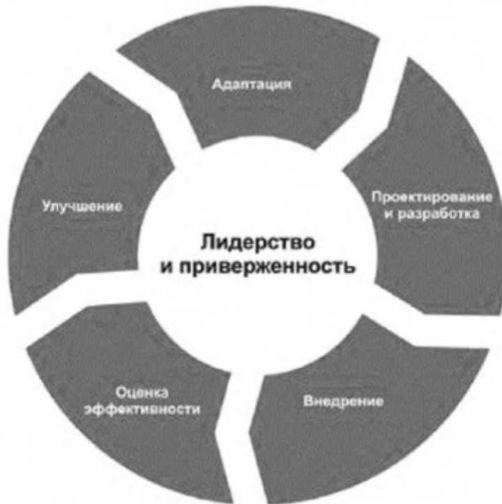
Рисунок 3 — Структура

Внедрение структуры менеджмента риска включает в себя интеграцию, проектирование и разработку, внедрение, оценку и улучшение менеджмента риска в организации. На рисунке 3 представлены компоненты структуры.