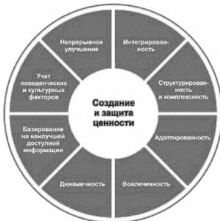
Рисунок 2 — Принципы

Принципы, представленные на рисунке 2, устанавливают характеристики эффективного и результативного менеджмента риска, отражают его ценности и объясняют его назначение и цель. Эти принципы являются основой менеджмента риска и должны учитываться при создании структуры и процесса менеджмента риска организации. Соблюдение принципов позволит организации управлять влиянием неопределенности в отношении достижения целей организации.